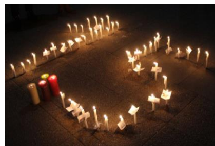
"1.5° Máximo".

El evento realizado globalmente (aproximadamente 130 países) apeló a la sensibilización de los ciudadanos de varios credos sobre la urgencia de la ratificación del acuerdo, que sólo entrará en vigor cuando fuere suscrito por aquellos países que representan por lo menos el 55% de las emisiones globales de los gases que causan el efecto invernadero. Aunque ya un record histórico ha sido alcanzado el último 22 de abril, día de la tierra, cuando 175 países firmaron el acuerdo en Nueva York. Aun así esa meta no fue alcanzada.