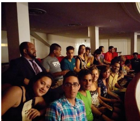
Participantes del Taller Nacional de formación de líderes